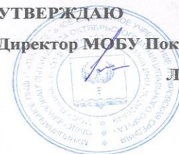
График проведения оценочных процедур в МОБУ Покровская СОШ на 2 четверть 2022-2023 учебного года